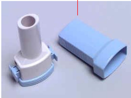
mondstuk uitsparing voor capsule